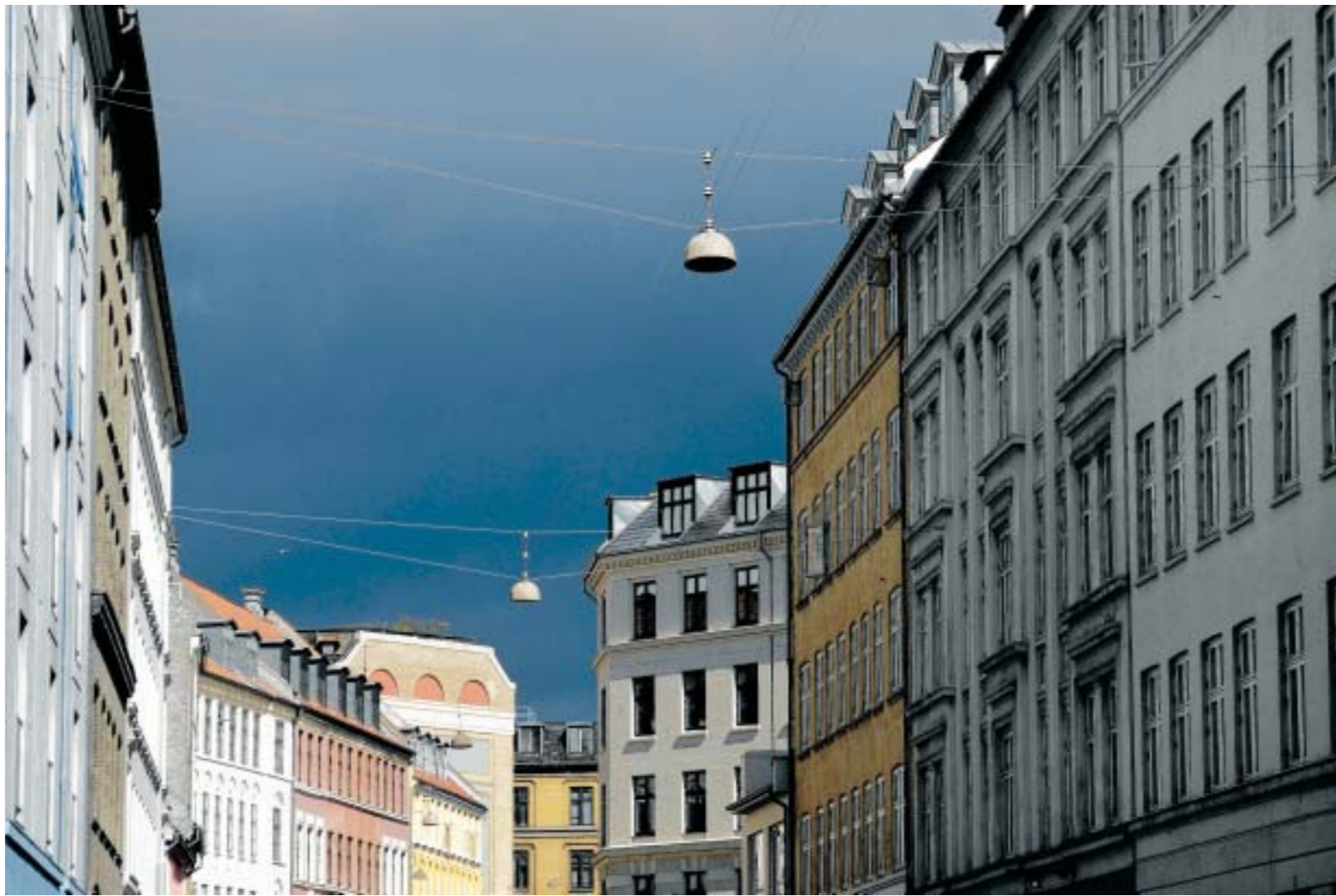
Da 1990'ernes byfornyelsesprojekt blev sat på vægeblus, var 50.000 københavnerejligheder ladt tilbage uden bad. Kronikøren foreslår at fortsætte, hvor byfornyelsen slap, men med mindre fokus på det kosmetiske og mere på funktion.

Desværre er eksemplet med hjemmehjælperne for handicappede og psykisk syge i København ikke et enestående eksempel. Flere og flere i den offentlige sektor oplever, at deres arbejdskraft bruges mere og mere til kontrol og dokumentation og mindre til kerneydelserne, og det tager arbejdsglæden fra folk. Ikke så mærkeligt at flere og flere bukker under i disse sektorer og langtidssigeltes. Der er brug for at få arbejdspladsen tilbage – ikke alene hos hjemmehjælperne, men også hos eksempelvis pædagoger, lærere, sygeplejersker og sagsbehandlere på arbejdsmarkedskontorerne og i socialforvaltningerne. Det koster at skabe og bevare velfærd, og Kristen-demokraterne prioriterer velfærd højere end skattelettelser.